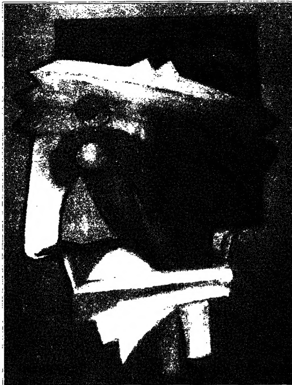
من اعمال الفنان